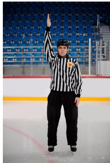
Отложенное положение «вне игры»

Вытянутая вперед свободная от свистка рука, направленная вдоль синей линии