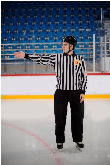
Положение «Вне игры»

Вытянутая вперед свободная от свистка рука, направленная вдоль синей линии